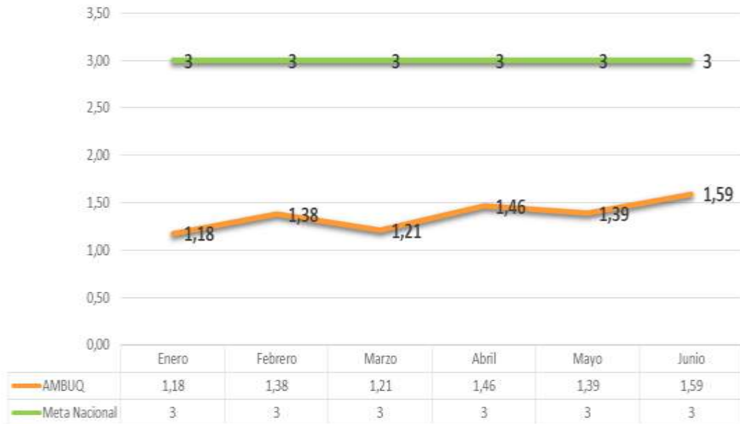
Oportunidad para la asignación de cita de Medicina General EPS AMBUQ - Periodo enero - junio 2019