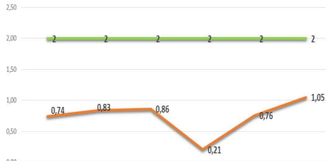
Promedio de tiempo de espera para la entrega de medicamentos incluidos en el POS enero - junio 2019